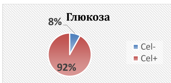
Рисунок 1.1 – Соотношение целлюлозоположительных и целлюлозоотрицательных клеток в популяции штамма Gluconacetobacter hansenii GH-1/2008 при культивировании на питательной среде, содержащей глюкозу

Рисунки должны иметь сквозную нумерацию в пределах главы арабскими цифрами. При этом номер рисунка состоит из номера главы и порядкового номера рисунка, разделенных точкой. Рисунки обязательно должны иметь наименования. Номер рисунка отделяется от его наименования с помощью тире. Номер и наименование помещаются после рисунка и центрируются. Точка в конце наименования рисунка не ставится. Например: