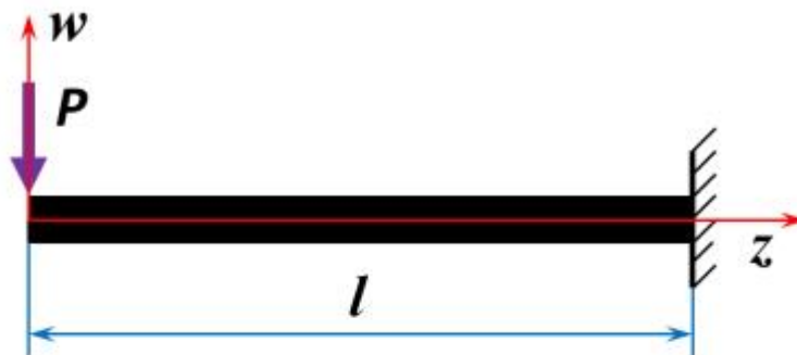
Рис. 1. Расчетная схема

Разработать программное обеспечение на языке C# или C++ в среде Visual Studio по анализу напряженно-деформированного состояния двух статически определимых балок с разными постоянными по длине поперечными сечениями. Расчетная схема балки представлена на рис. 1.