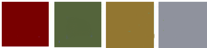
Рис.6. Пример студенческого творческого задания «Рациональное использование цвета в компьютерном машиностроительном чертеже» Перечень комплектов заданий