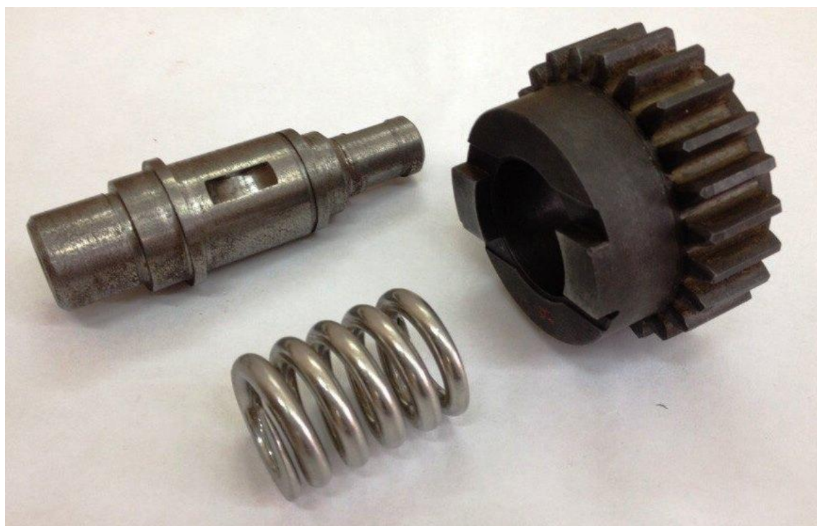
Рис. 2. Фото одного из вариантов вала, шестерни, пружины.

Привести в соответствие с существующими стандартами