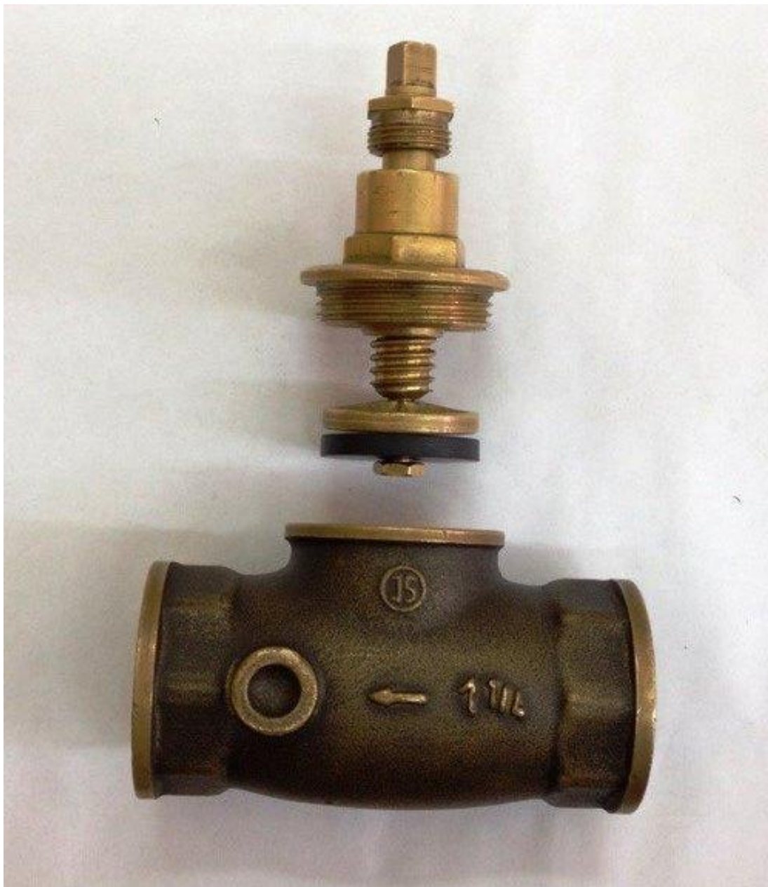
Рис.3. Пример сборочной единицы.

Выполнить эскизы (ручное эскизирование) деталей, входящих в сборочную единицу. Назначить размеры и произвести необходимые измерения. Выпустить чертеж общего вида заданной сборочной единицы. Выполнить спецификацию.