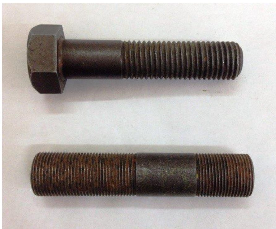
Рис.1. Фото одного из вариантов резьбовых крепежных деталей.

Выполнить эскизы резьбовых крепежных деталей (болт, шпилька). Выполнить измерения резьбы. Скомпоновать, рассчитать и выпустить сборочный чертеж резьбовых соединений для заданных деталей с привлечением справочных данных по резьбам, резьбовым деталям и резьбовым соединениям (стандарты ЕСКД).