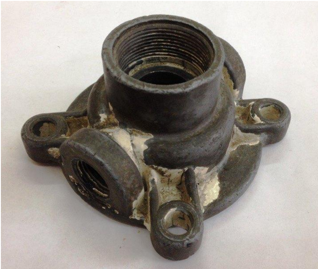
Рис. 5. Пример зачетного задания.

Выполнить эскиз машиностроительной детали средней сложности. Выбрать необходимое и достаточное количество изображений. Скомпоновать эскиз и выполнить изображения в проекционной связи. Назначить размеры. Произвести измерения. Проставить размерные числа.