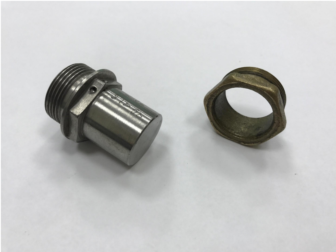
Рис.4. Пример контрольного задания

Выполнить эскиз одной из деталей сборочной единицы.