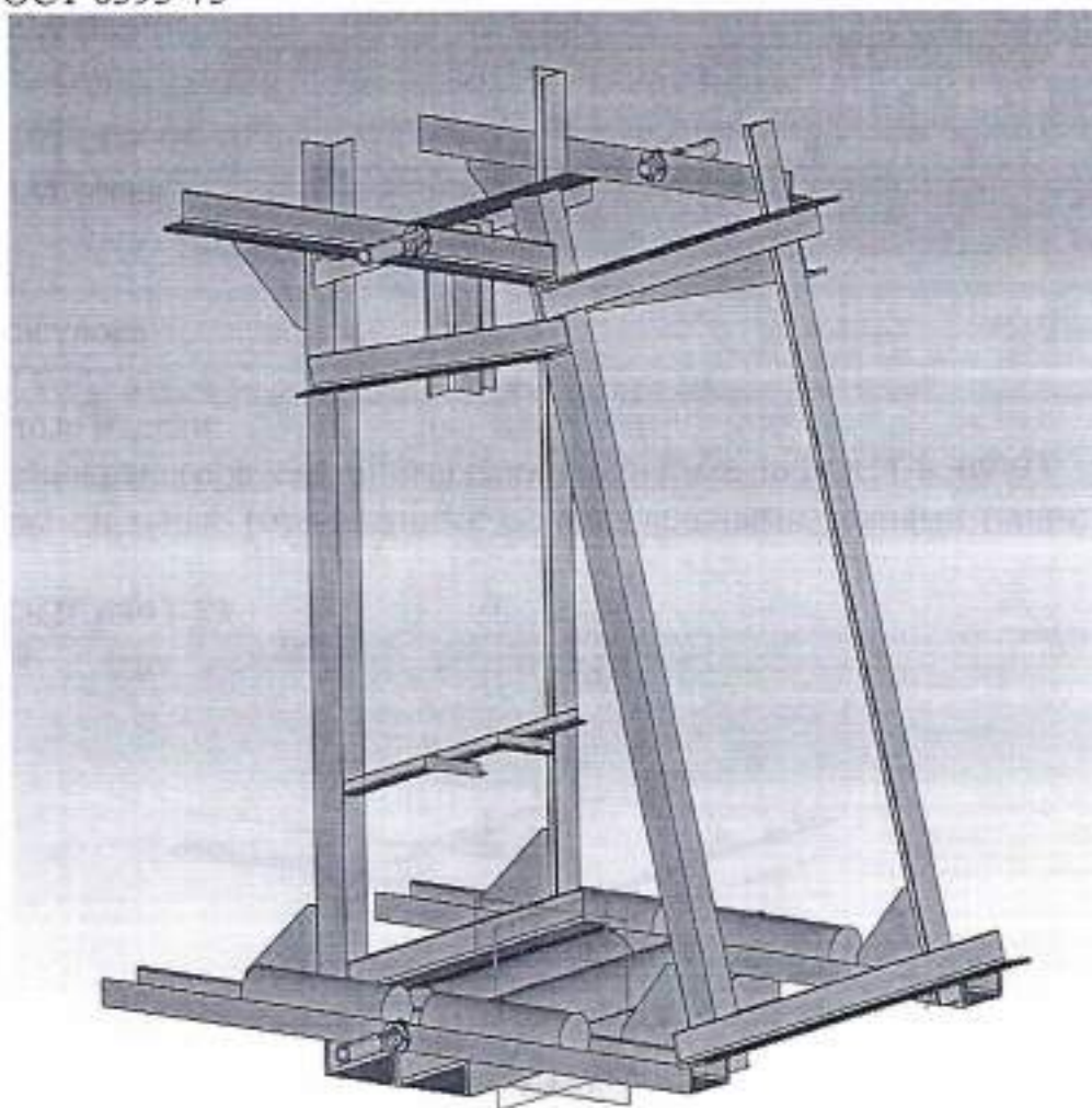
Рисунок 1. Общий вид Сборки Клетя