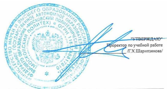
График учебного процесса на 2024 - 2025 учебный год