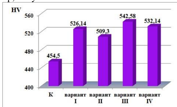
Рисунок 1 - Влияние материала катода имплантера на нанотвердость

Если рисунок один, то он обозначается «Рисунок 1». Слово «рисунок» и его наименование располагают посередине строки. Допускается нумеровать иллюстрации в пределах раздела. В этом случае номер иллюстрации состоит из номера раздела и порядкового номера иллюстрации, разделенных точкой. Например, Рисунок 1.1.