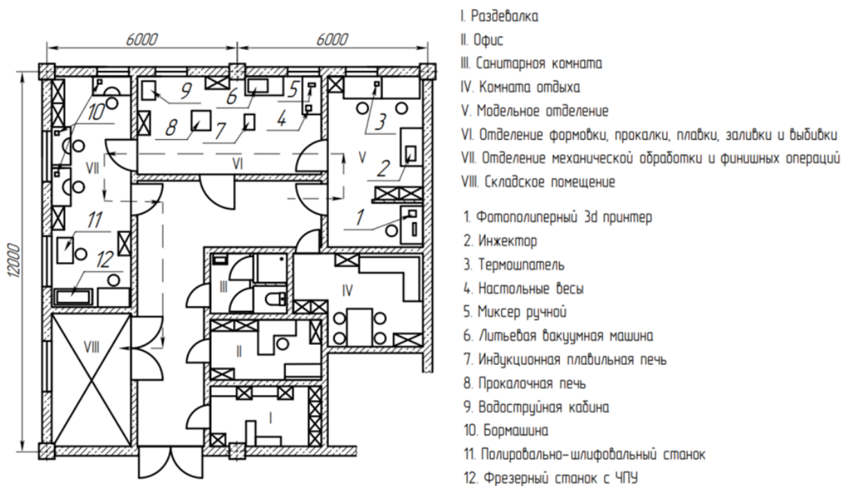
Рис. 5.1. Участок художественного литья производительностью 0,5 т/год

Производственные отделения следует располагать в соответствии с последовательностью этапов технологического процесса. Траектория движения получаемого изделия, которую показывают на планировке производственных участков штриховыми линиями со стрелкой, не должна пересекать саму себя. По возможности, следует избегать встречного направления движения по этой траектории.