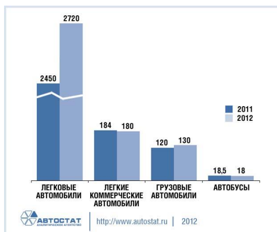
Рисунок 2 – Прогноз развития автомобильного рынка

Иллюстрации каждого приложения обозначают отдельной нумерацией арабскими цифрами с добавлением перед цифрой обозначения приложения. Например, Рисунок А.3. При ссылках на иллюстрации следует писать «... в соответствии с рисунком 2» при сквозной нумерации и «... в соответствии с рисунком 1.2» при нумерации в пределах раздела. Сокращения слова рисунок при ссылке в тексте недопустимы.