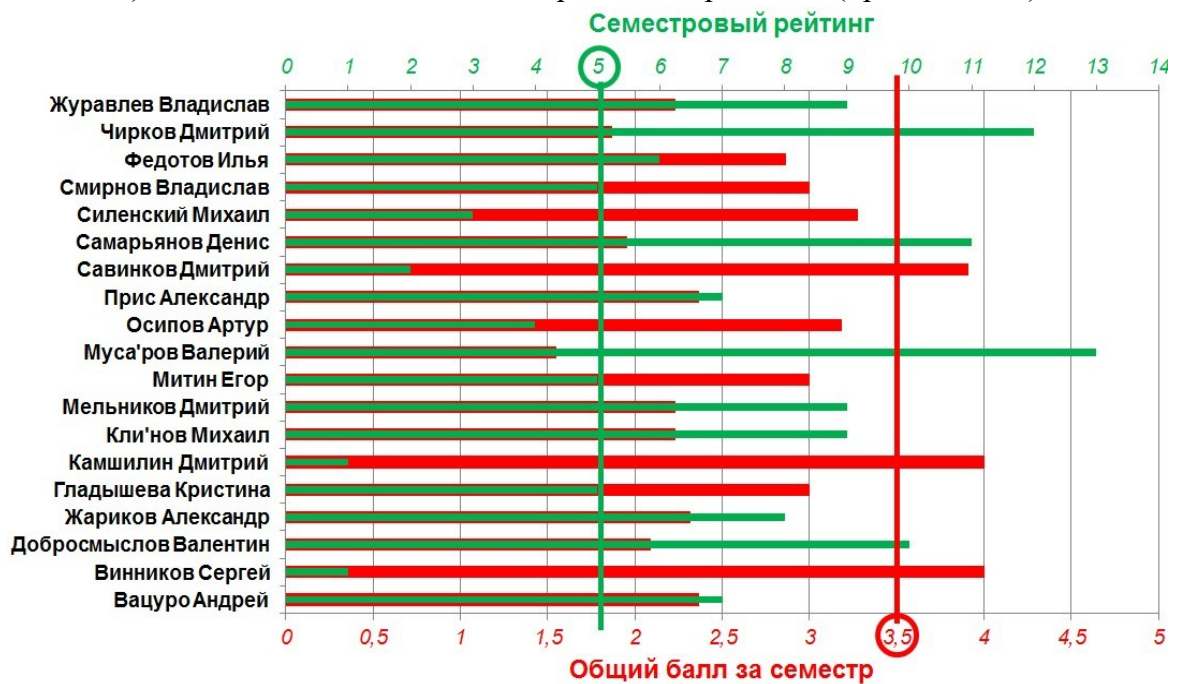
д) контроль успеваемости (за семестр)