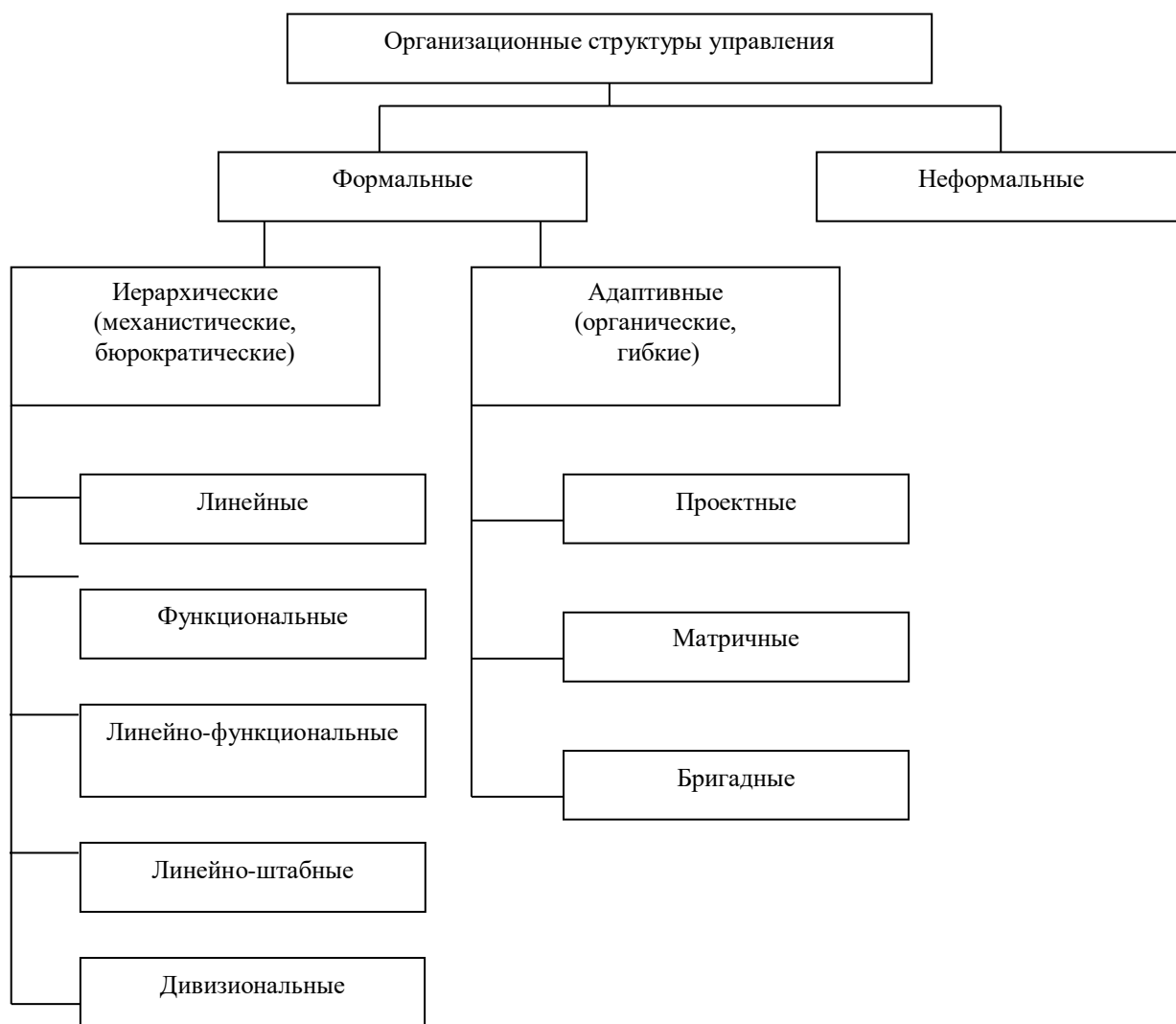
Рис. 2. Классификация типов организационных структур управления

На рис. 2 представлены основные типы организационных структур управления.