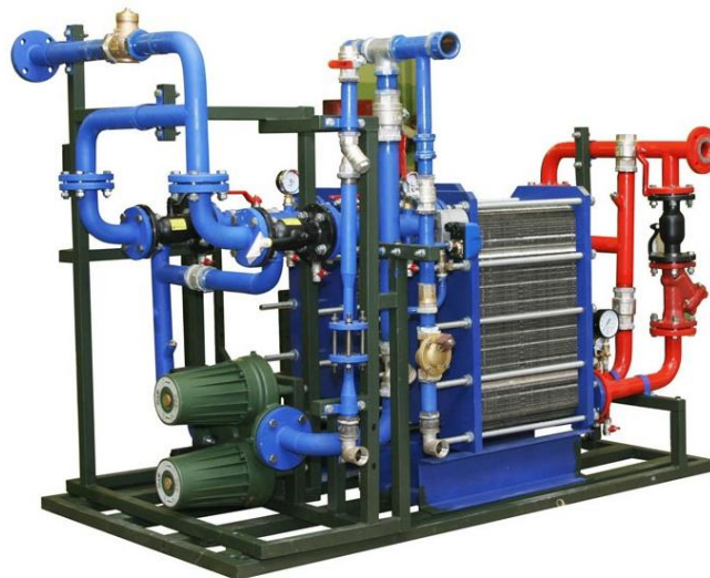
Рис. 1. Индивидуальный тепловой пункт